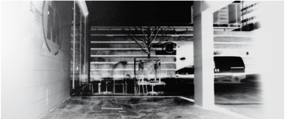
Sténopé (détail), transformation de l'espace m en camera obscura, 2011 Production d'étudiants en arts plastiques de l'Université Rennes 2

Sténopés d'étudiants en arts de l'université et de l'école régionale des beaux-arts de Rennes.